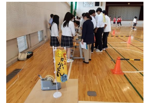
四日市西高等学校

今年は9月6日・7日に文化祭があります。8月下旬から、四日市西高校の生徒も夏季課外、校外模試対策、そして文化祭でのクラス発表準備と過ごしてきました。高校生活で一番盛り上がる時期です。今年の文化祭は参観希望の保護者の方が見学してもらえます。3年生は飲食模擬店として、工夫を凝らした手作り感の味を出してくれることと思います。2年生はクラスが一団となったダンスシーン、1年生はいろいろな模擬店と楽しい文化祭で盛り上がることと思いますので、また報告させていただきます。