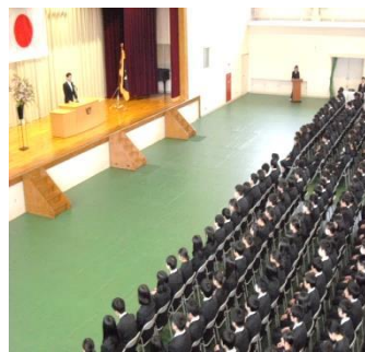
4月8日 入学式（体育館にて）

先月、新しい制服を身に着けた新入生を迎えたと思っていたら、ゴールデンウィークも過ぎ去り、もう中間考査の時期です。気温も次第に高くなり勉強や部活動に快適な時期となりました。