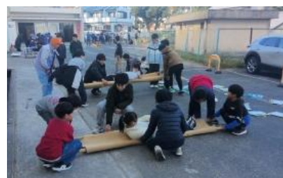
簡易担架の作り方