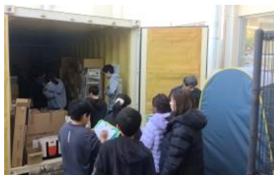
防災倉庫内の見学