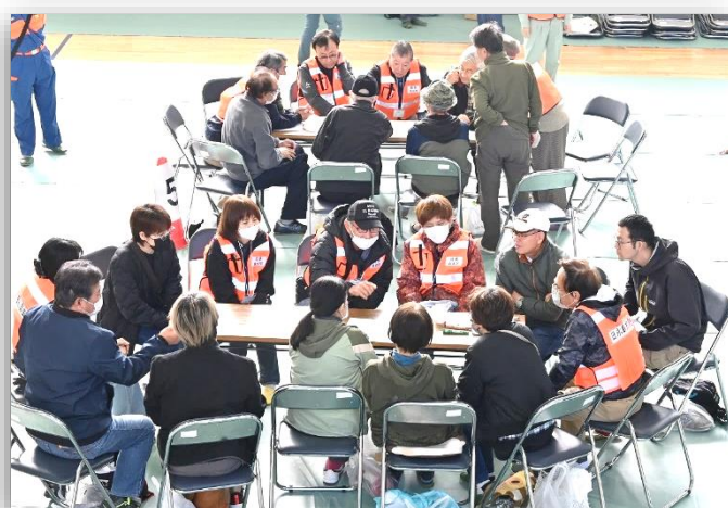
地区別図上訓練の様子