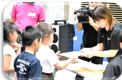
真優選手より色紙プレゼント