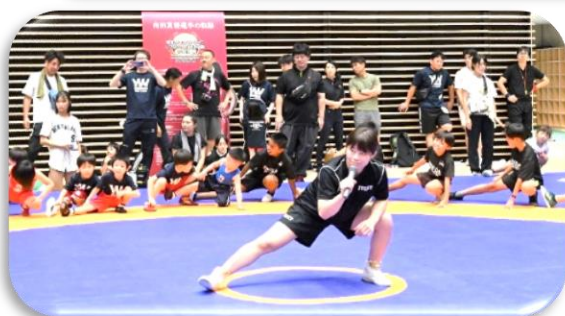
レスリング交流会