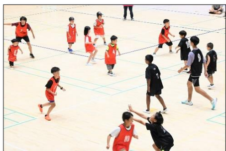
スポーツ鬼ごっこ