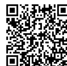
出展者向けチラシ

（☎ 080-1598-9214 ✉ supoyon@tsv2020yokkaichi.or.jp）