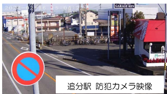
追分駅 防犯カメラ映像