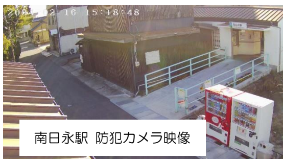
南日永駅 防犯カメラ映像

四日市市では、地域における防犯環境の向上を図るため、不特定多数の人が往来する駅前広場など公共の場所への防犯カメラの設置を進めています。このたび、南日永駅、追分駅に新たな防犯カメラを設置しましたのでお知らせします。 問い合わせ 市民協働安全課 ☎ 059-354-8179