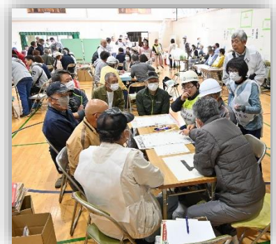
段ボール簡易トイレ作り